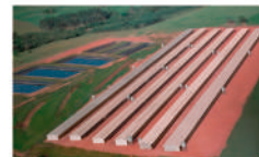
Integrado da TresBomm Iporã, Paraná