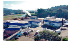
Planta de cortes Laranjeiras do Sul, Paraná