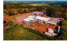
Planta de abate Toledo, Paraná

Fazemos questão que todos nossos processos e serviços sejam rigorosamente auditados por empresas especializadas. Assim, continuamos aprimorando não só a gestão do nosso negócio, tal como nossa relação com o ecossistema. E fazemos questão que todos os contratos celebrados com nossos parceiros comerciais e prestadores de serviços sigam nessa direção, aliando objetivos comuns, metas tangíveis, boas práticas e sustentabilidade.