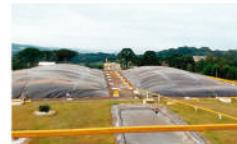
Biodigestor Aurora do Iguaçu, Paraná